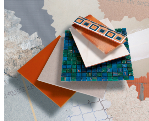
Variables Leistungsspektrum – für alle Untergründe und alle keramischen Beläge.