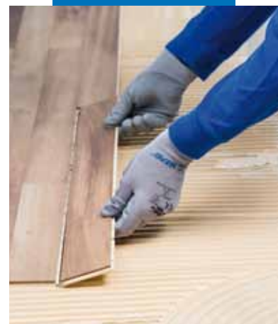
Verlegung des Parketts